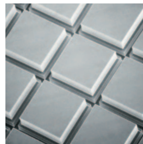
ステップカット加工例