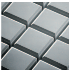
ベベルカット加工例